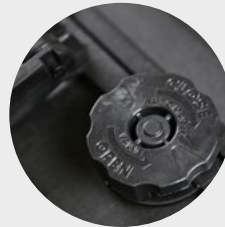
Wasser- und staubdicht