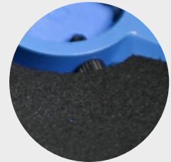
Europäischer Zertifizierter Schaumstoff